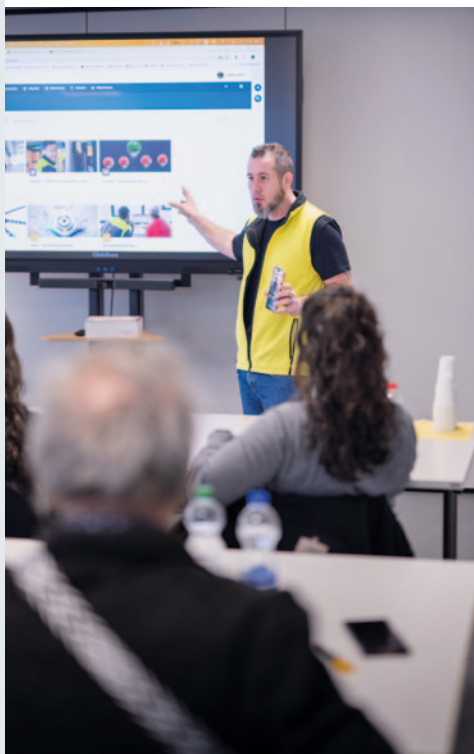
Die Mitarbeitenden wurden auf die Lernplattform geschult - die Rückmeldungen waren durchgehend positiv

Mit der Einführung von CampLus wurde ein wichtiger Schritt in der digitalen Lernwelt gemacht. SWISS LOGISTICS setzt damit einen zukunftsweisen Standard für eine moderne, flexible und effiziente Weiterbildung, welche die Logistikbranche fit für die kommenden Herausforderungen macht. ■