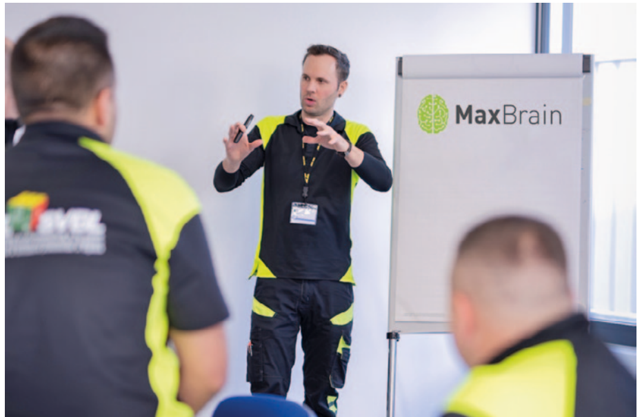
Blended Learning schliesst die Lücke zwischen theoretischem Wissen und praktischer Umsetzung

Die langfristige Vision von SWISS LOGISTICS CampLus geht über die aktuelle Nutzung hinaus. Die Plattform soll künftig nicht nur für die interne Weiterbildung, sondern auch für die höhere Berufsbildung und weitere Projekte eingesetzt werden. Ziel ist es, die Lernplattform kontinuierlich zu erweitern und in verschiedene Bereiche des Unternehmens zu integrieren, um eine ganzheitliche und zukunftsorientierte Kompetenzentwicklung zu ermöglichen.