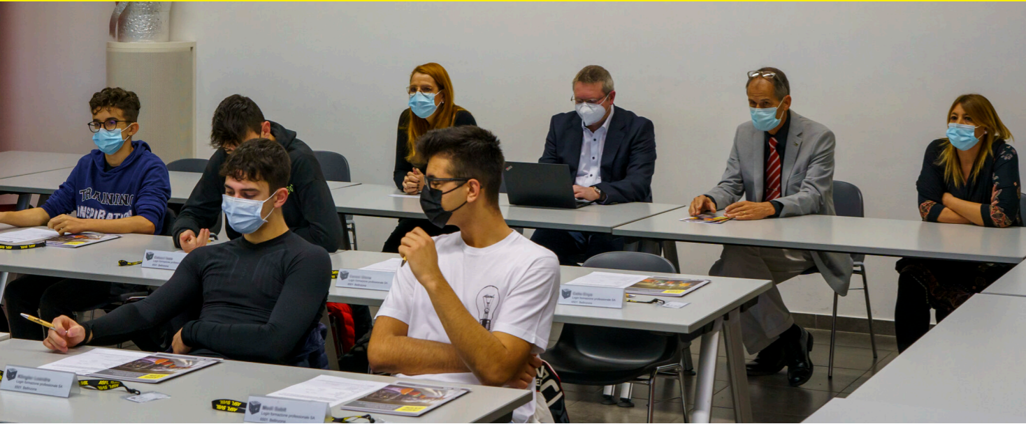
Ausbildungs-Sequenz während des Audits in Giubiasco.

der BBK waren in Giubiasco anwesend und anlässlich dieser Sitzung wurden wichtige Weichen für die Strategie gestellt.