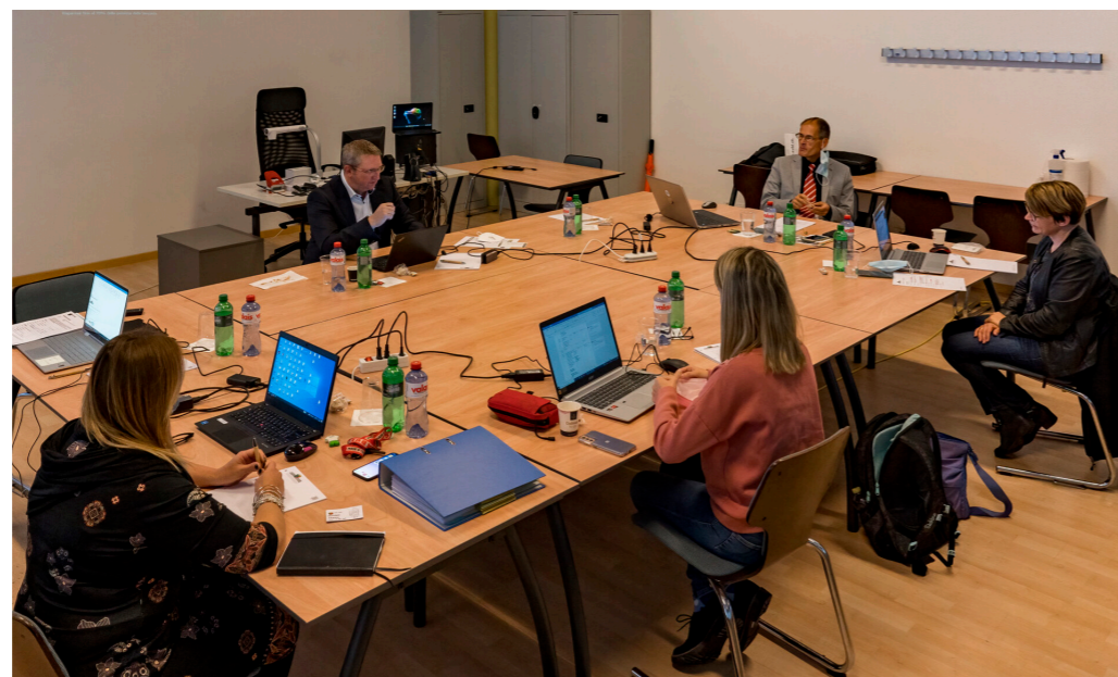
Die einzelnen Punkte der Zertifizierung werden erörtert.

Das Wissensmanagement ist für eine Ausbildungsorganisation zentral. Dabei ist das Wissen jedes einzelnen Mitarbeitenden zu erfassen und zu dokumentieren, aber auch das Gesamtwissen der Organisation ASFL SVBL – etwa als gesammeltes Wissen der Geschäftsleitung. Diese Aufgabe liegt nun beim Qualitätsteam in allen Sprachregionen.