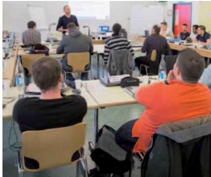
Fortbildungs-Klasse in den Schulungsräumen des AZL Rapperswil.

Der Erfolg eines Unternehmens steht und fällt mit der Kompetenz der Mitarbeiter und Führungskräfte. Die Angestellten be-